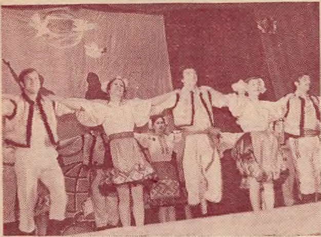
Напярэдадні Першамая ў БДУ праходзіў агляд факультэцкіх калектываў мастацкай самадзейнасці. З цікавымі праграмамі выступілі філолагі, юрысты, біёлагі, калектывы іншых факультэтаў.

НА ЗДЫМКАХ: дэманструюць сваё майстэрства артысты-аматары з геафана і факультэта журналістыкі.